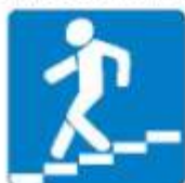
Знак 6.6. Подземный пешеходный переход

Самые безопасные переходы — подземный и надземный. Они обозначаются вот такими знаками.