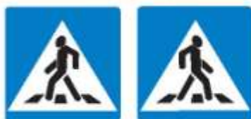
Знаки 5.19.1 и 5.19.2 Пешеходный переход

Если нет подземного или надземного пешеходного перехода, можно перейти по наземному пешеходному переходу