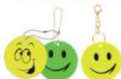
Брелоки и подвески