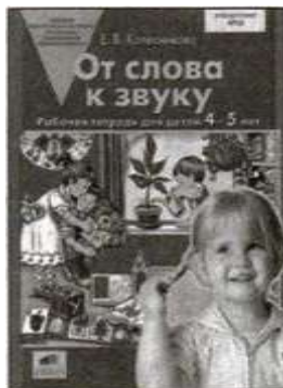
«От слова к звуку». Рабочая тетрадь для детей 4—5 лет.