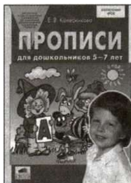
«Прописи для дошкольников 5—7 лет».