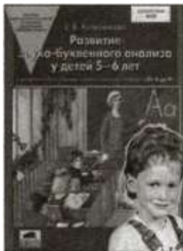
«Развитие звуко- буквенного анализа у детей 5—6 лет». Учебно-методическое