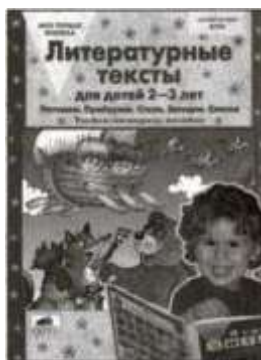
«Литературные тексты для детей 2—3 лет». Учебно-наглядное пособие.