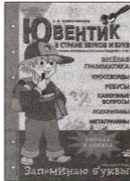
«Ювентик в стране звуков и букв». Рабочая тетрадь для детей 5—7 лет.