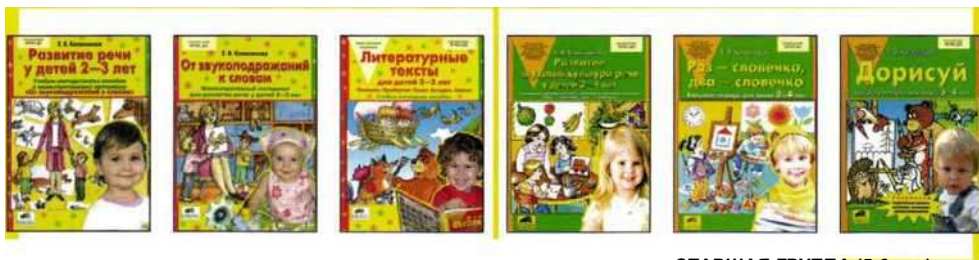
СРЕДНЯЯ ГРУППА (4-5 лет)

ПРОГРАММА «От звука к букве. Формирование аналитико-синтетической активности как предпосылки обучения грамоте» И НАГЛЯДНО-МЕТОДИЧЕСКОЕ ОБЕСПЕЧЕНИЕ ПЕРВАЯ МЛАДШАЯ ГРУППА (2-3 года) ВТОРАЯ МЛАДШАЯ ГРУППА (3-4 года)