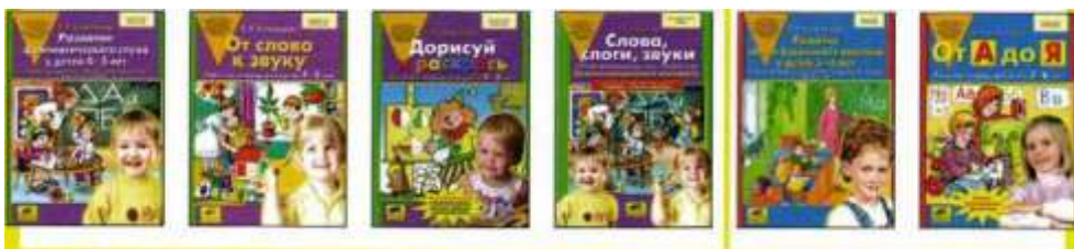
СТАРШАЯ ГРУППА (5-6 лет)