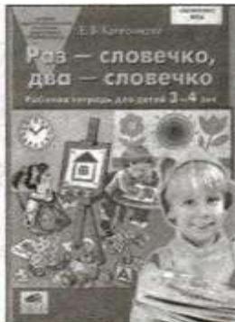
«Раз — словечко, два — словечко». Рабочая тетрадь для детей 3—4 лет.