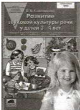
«Развитие звуковой культуры речи у детей 3—4 лет». Учебно-методическое пособие.