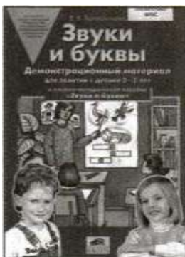
«Звуки и буквы». Демонстрационный материал для занятий с детьми 5—6 лет.