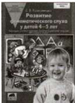
«Развитие фонематического слуха у детей 4—5 лет». Учебно-методическое пособие.