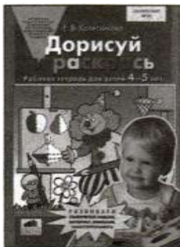
«Дорисуй и раскрась». Рабочая тетрадь для детей 4—5 лет. «Слова, слоги, звуки». Демонстрационный материал для занятий с детьми 4—5 лет.