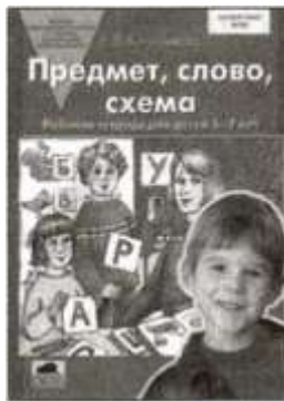
«Предмет, слово, схема». Рабочая тетрадь для детей 5—7 лет.

Преимущества такого авторского подхода очевидны, так как создают возможность: