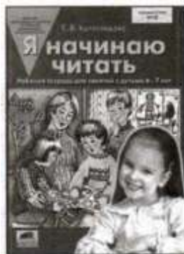
«Я начинаю читать». Рабочая тетрадь для детей 6—7 лет.