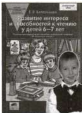
«Развитие интереса и способностей к чтению у детей 6—7 лет». Учебно-методическое пособие.