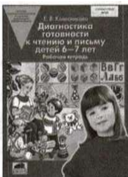
«Диагностика готовности к чтению и письму детей 6—7 лет». Рабочая тетрадь.