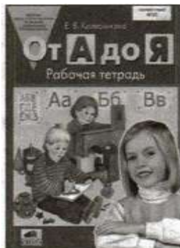
пособие. «От Адо Я». Рабочая тетрадь для детей 5—6 лет.