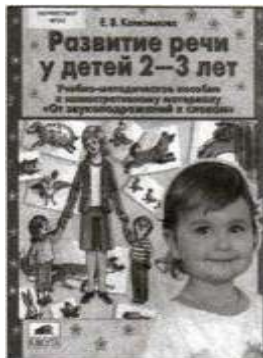
«Развитие речи у детей 2—3 лет». Учебно-методическое пособие к иллюстративному материалу «От звукоподражаний к словам».