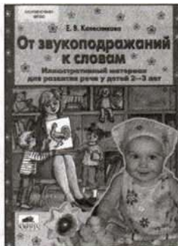
«От звукоподражаний к словам». Иллюстративный материал для развития речи у детей 2—3 лет.